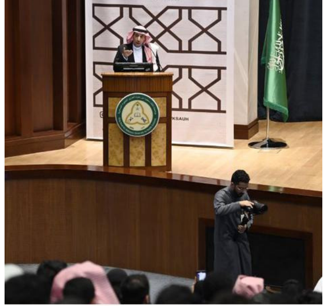
قصيدة الشاعر الدكتور/ عبدالرحمن العتل